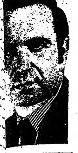
وزير الصناعة جددون بات في كرمئيل.

الناصرة - ارسلنا - دعا وزير الصناعة والتجارة والسياحة السيد جددون بات الصناعيين العرب واصحاب رؤوس الاموال للمبادرة من اجل اقامة المصانع في الوسط العربي والسيد بات يتحدث في اجتماع للصناعيين واصحاب رؤوس الاموال العرب واليهود عقد في بلدة كرمئيل.